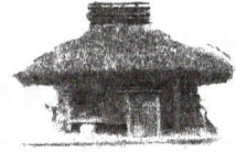
平成幻住庵の模型 森脇旭一氏 作